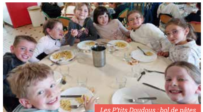
Les P'tits Doudous : bol de pâtes