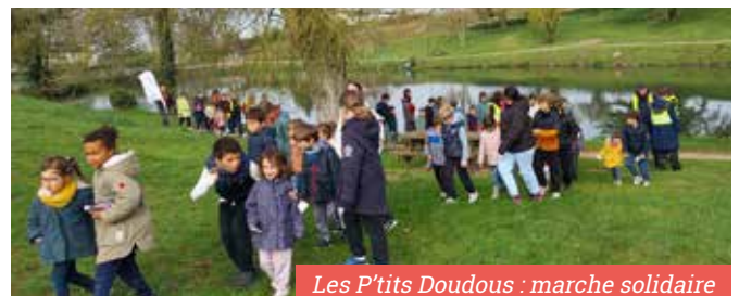
Les P'tits Doudous : marche solidaire