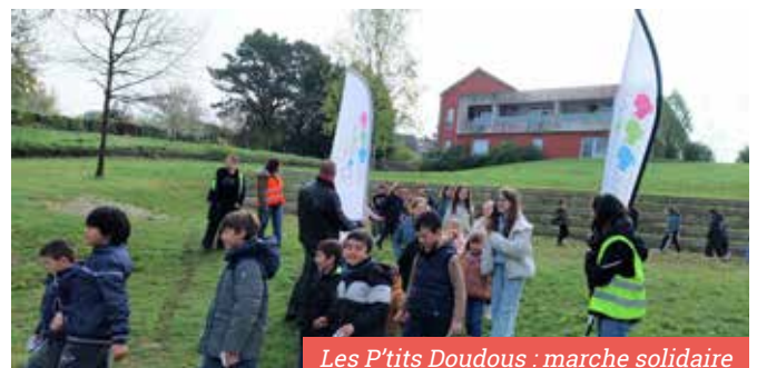
Les P'tits Doudous : marche solidaire