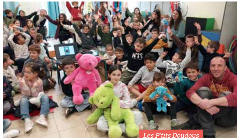
Les P'tits Doudous