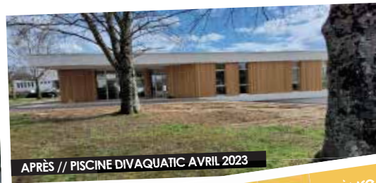
APRÈS // PISCINE DIVAQUATIC AVRIL 2023