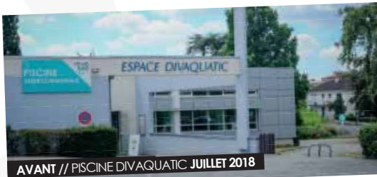
AVANT // PISCINE DIVAQUATIC JUILLET 2018