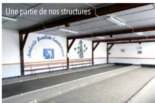
Une partie de nos structures