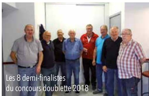
Les 8 demi-finalistes du concours doublette 2018

L'Amicale Bouliste Landréenne a toujours le vent en poupe. Depuis l'assemblée générale qui a eu lieu en janvier, les joueurs n'ont cessé de s'entraîner. Ces « sportifs » n'avaient d'ailleurs pas le choix « concours oblige ». En effet, le concours en doublette a commencé fin avril, et à l'heure où nous écrivons, nous en sommes aux demi-finales. Beaucoup de belles équipes ont déjà disparu, il faut dire que le niveau de jeu de nos adhérents s'améliore d'année en année. La finale a lieu le 23 juin, nous vous en reparlerons dans la prochaine Vie Landréenne.